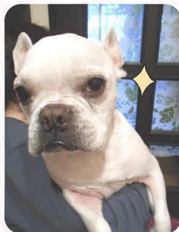
神奈川県 梵子利 福丸くん

お客さまから届いたペットの写真をご紹介します。ご提供ありがとうございます！次号以降も皆様からペットの写真を募集します！詳しくは弊社スタッフまで！