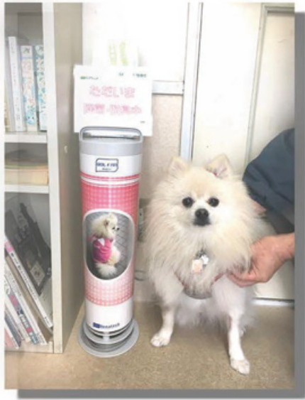
(神奈川県・すずき動物病院様)

お気に入りの写真で お客様だけのオリジナルパネルを 無料 でお作りします! お気軽にお問合せください🐾